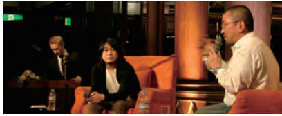
Vol.1 Dojima Juku